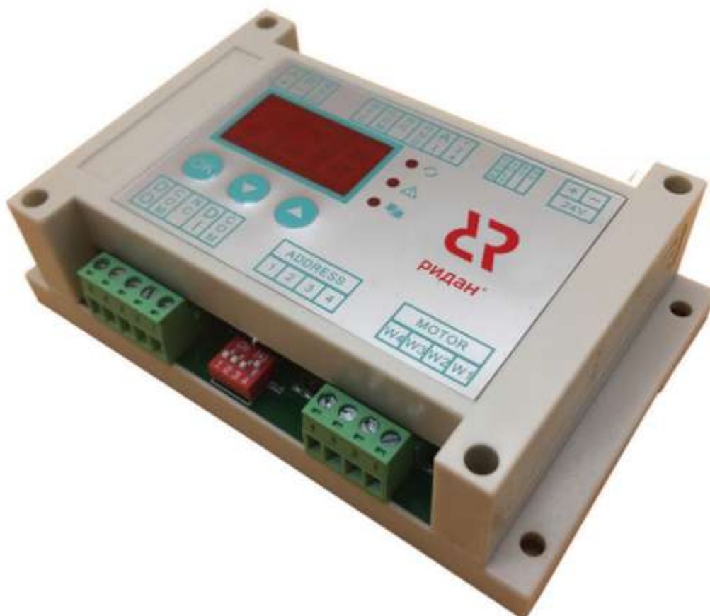
Рис. 1 Внешний вид контроллера

Контроллер типа Р-КИ выполнен в одном корпусе. Для настройки и отображения параметров используется встроенный дисплей.